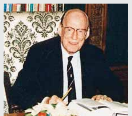
Prof. M. v. Ardenne

Bei rund 45% der Menschen, vor allem oberhalb des 50sten Lebensjahres, können Sauerstoffdefizite vorhanden sein, die Energiedefizite auslösen. Personen, bei denen Sie in Ihrer Apotheke ein Energiedefizit feststellen konnten, sind daraufhin für eine OXICUR Sauerstoff-Kur und ergänzende Vitalstoffe aufgeschlossen. Damit sichern Sie sich nicht nur die Wertschätzung Ihrer Kunden, sondern bekommen eine Eigenmarke, die von keiner Discount- oder Versand-Apotheke preislich unterboten werden kann.